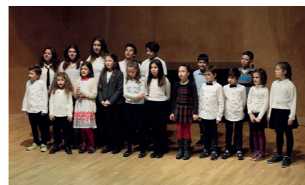
Детски хор от „Кирил и Методий“