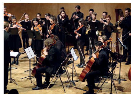
Оркестърът на Курбевоа