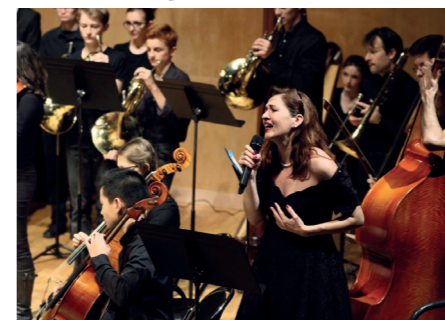
Оркестърът на Курбевоа и Джина ДиДонато, Ню-Йорк