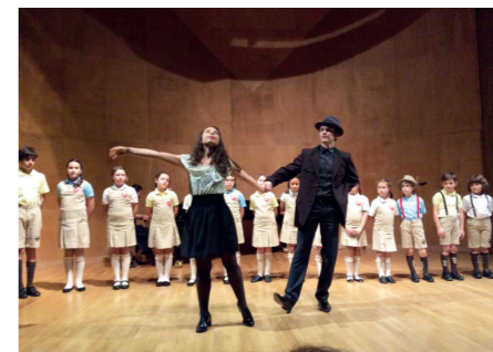
Детски хор „Гергана“, Ню-Йорк